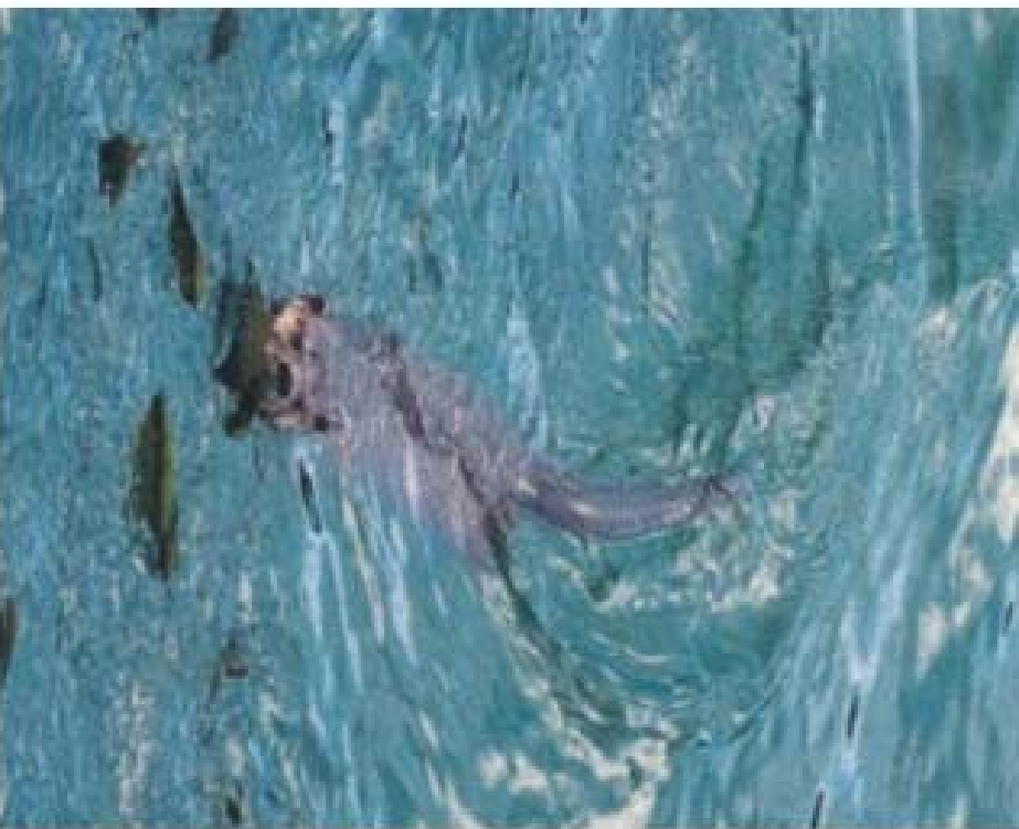
Huillín o lobo de río patagónico ( Lutra provocax ).