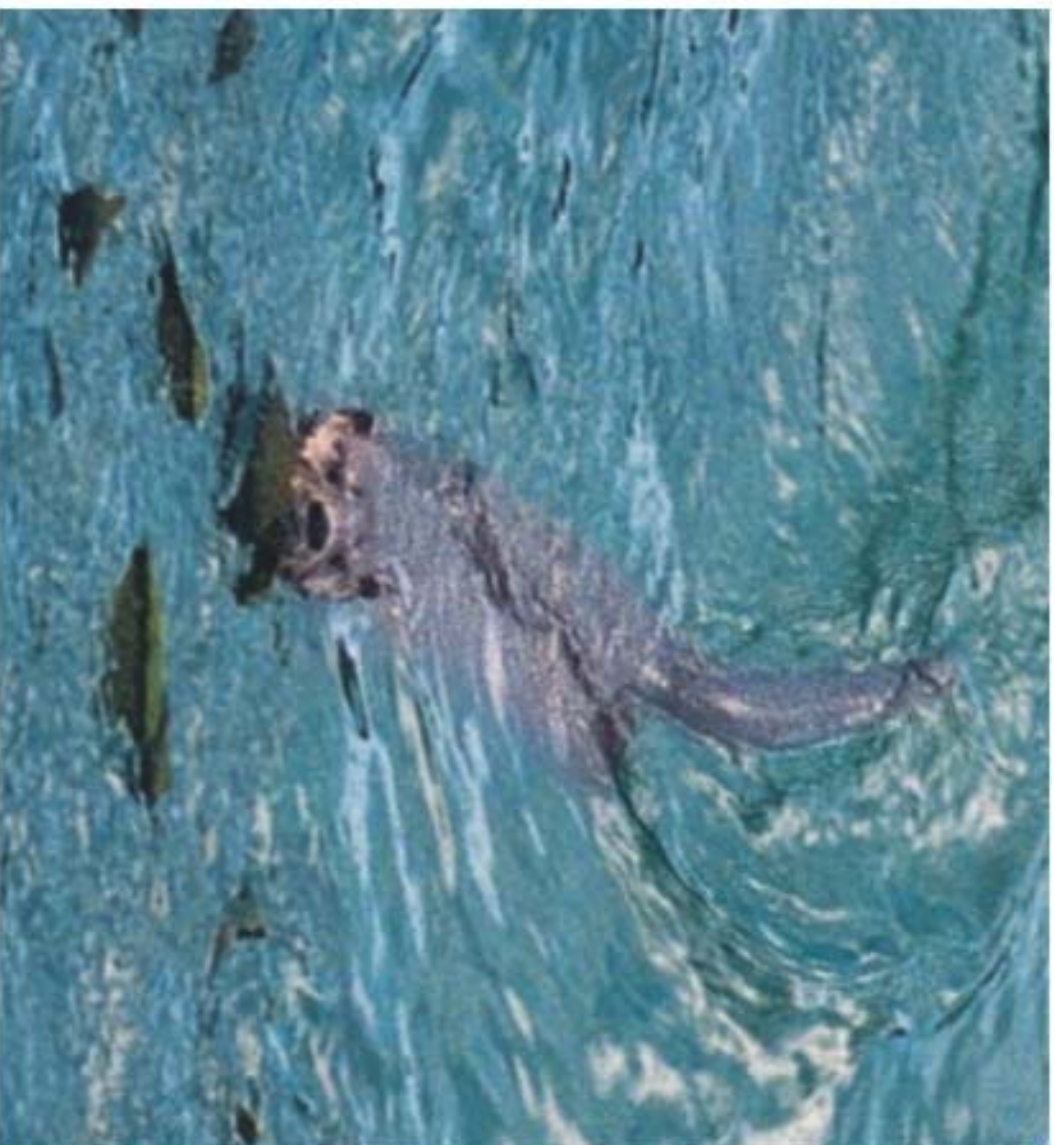
Huillín o lobito de río patagónico ( Lutra provocax ).