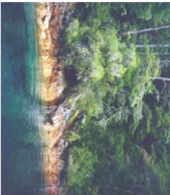
Costa en el lago Nahuel Huapi.